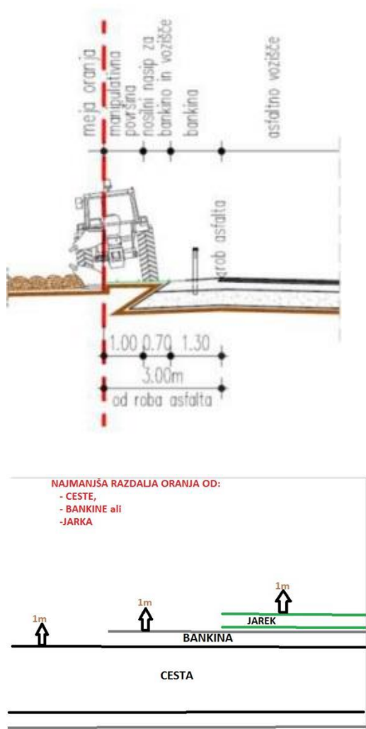
Slika 1: ORANJE VZPOREDNO S CESTO

Na slikah, spodaj, so navedeni primeri pravilnega vzporednega in pravokotnega oranja s cesto, ki pri oranju upoštevajo tudi odmik od cestnega telesa in ne samo od roba asfalta oziroma vozišča: